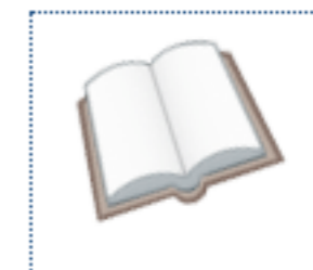
ブックマーク (2) ブックマークした車両の一覧を 表示します。

・右端の「ブックマークから削除」を選択すると、確認ダイアログ表示され「OK」を押すと、ブックマークから削除されます。 (青枠部分)